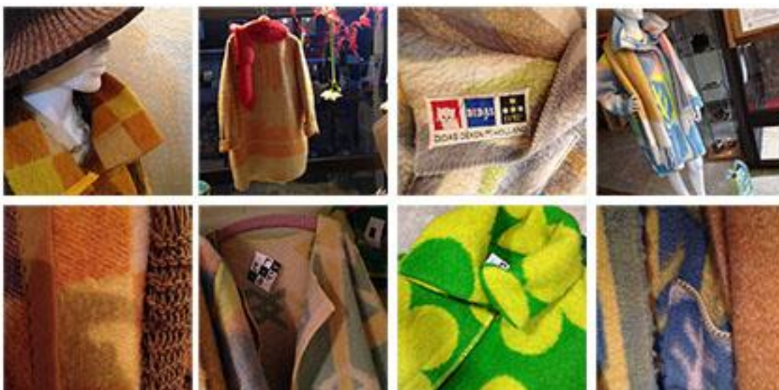
Collectie Winterjassen van wollen dekens, design Angelique Heijligers bij inspiratiewinkel